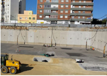
Construcción a un metro por debajo del nivel freático