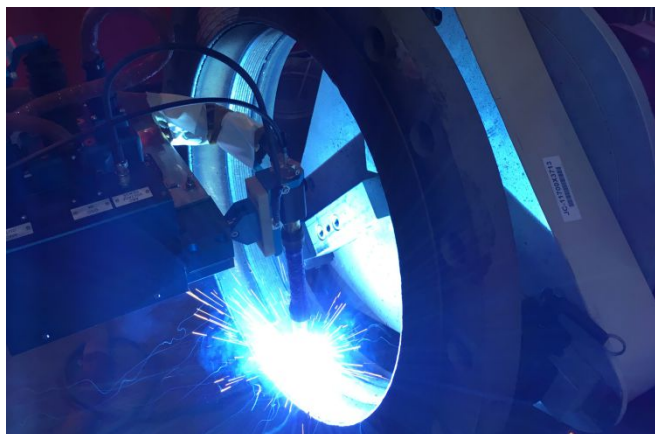
Рис. 2: Sulzer

Благодаря технологии CladFuse™ компания Sulzer может произвести наплавку на внутреннюю стенку до необходимого диаметра и восстановить требуемые параметры по давлению. И также обеспечить лучшую защиту от коррозии и эрозии, используя сплавы с улучшенными характеристиками.