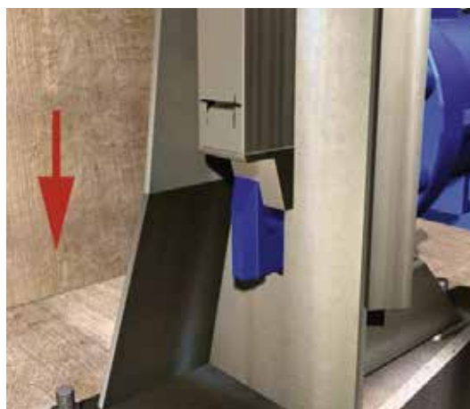
Bloqueo (vista interior)