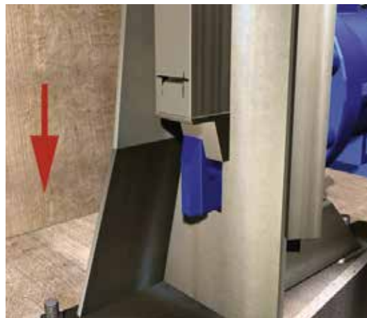
Sprzęganie (widok od wewnątrz)