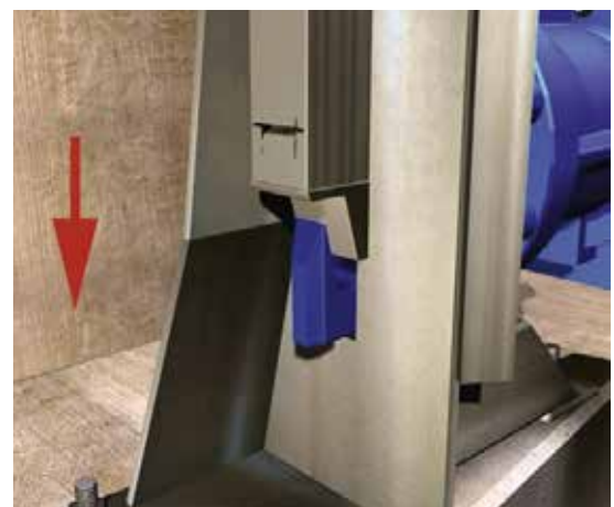
Låsning (sett inifrån)