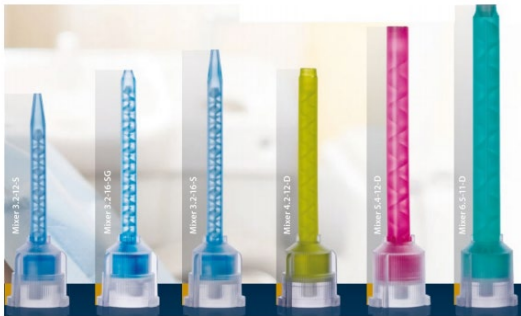
Fig. 1: Puntali di miscelazione oggetto dell'impegno

e con i fratelli proprietari dell'azienda. L'accordo prevedeva l'impegno da parte di Ritter (con tanto di clausola penale contrattuale) di non offrire più i seguenti puntali di miscelazione dentali: