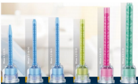
Fig. 2: Puntali di miscelazione, leggermente diversi, di Ritter