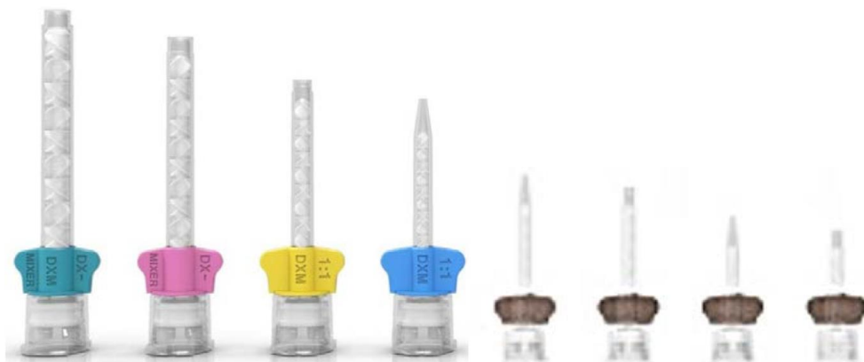
Figura A: Pontas misturadoras proibidas