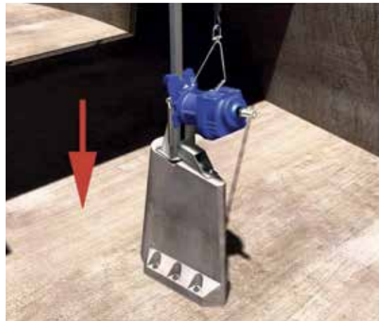
Descenso del equipo