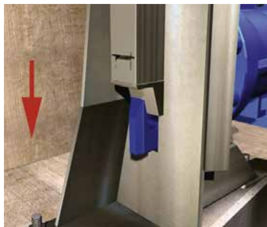
Bloqueo (vista interior)