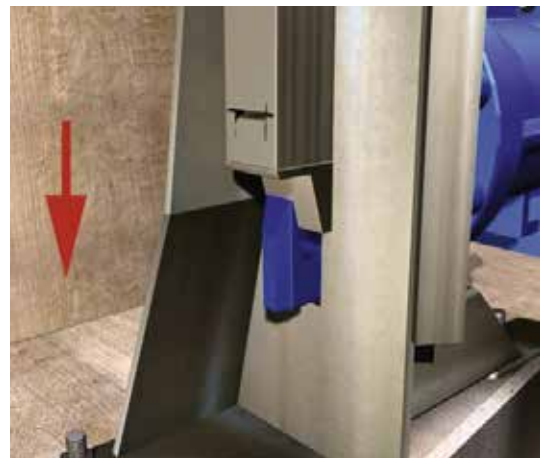
Bloqueo (vista interior)