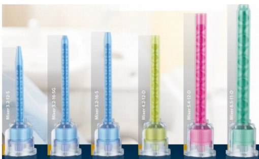
Fig. 2 : embouts de mélange Ritter légèrement modifiés