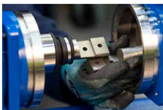
6. Отсоедините гидравлический ротор от приводного вала