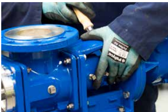
1. Демонтируйте статор и ротор, обеспечьте доступ к приводу

Винтовой насос для сточных вод – это самая современная конструкция насоса, которая благодаря стягивающим зажимам статора, устраняет необходимость в стяжных шпильках. Для минимизации времени и затрат при обслуживании винтового насоса, он может быть обслужен прямо на месте, без отсоединения и снятия каких-либо труб. Например, приводной механизм полностью, включая ротор, статор, вал, шток и уплотнение, можно снять менее чем за 4 минуты.