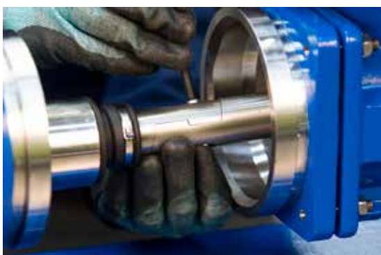
5. Разъем муфты соединяется вместе с помощью винтов

Быстросъемная соединительная штанга - это муфта специального сечения, разработанная для быстрой сборки и разборки насоса на месте.