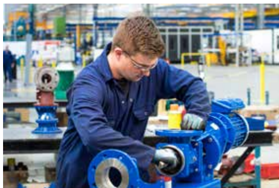
2. Отодвиньте защитный кожух и извлеките шпильку