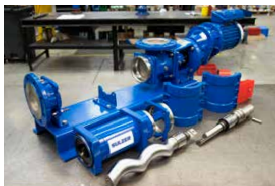
4. Все изнашиваемые детали легко демонтируются