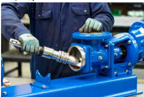
3. Извлеките приводной вал