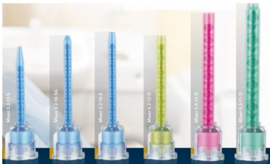
图 2 Ritter 略有不同的牙科混合管