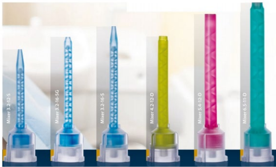
图 1 承诺书中的混合管