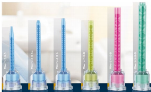
Fig. 2: Pontas misturadoras ligeiramente diferentes da Ritter