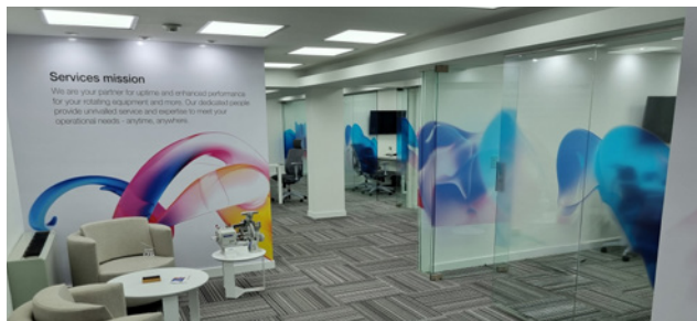
Buenos Aires main office

How can we help you? Contact us today to find your best solution.