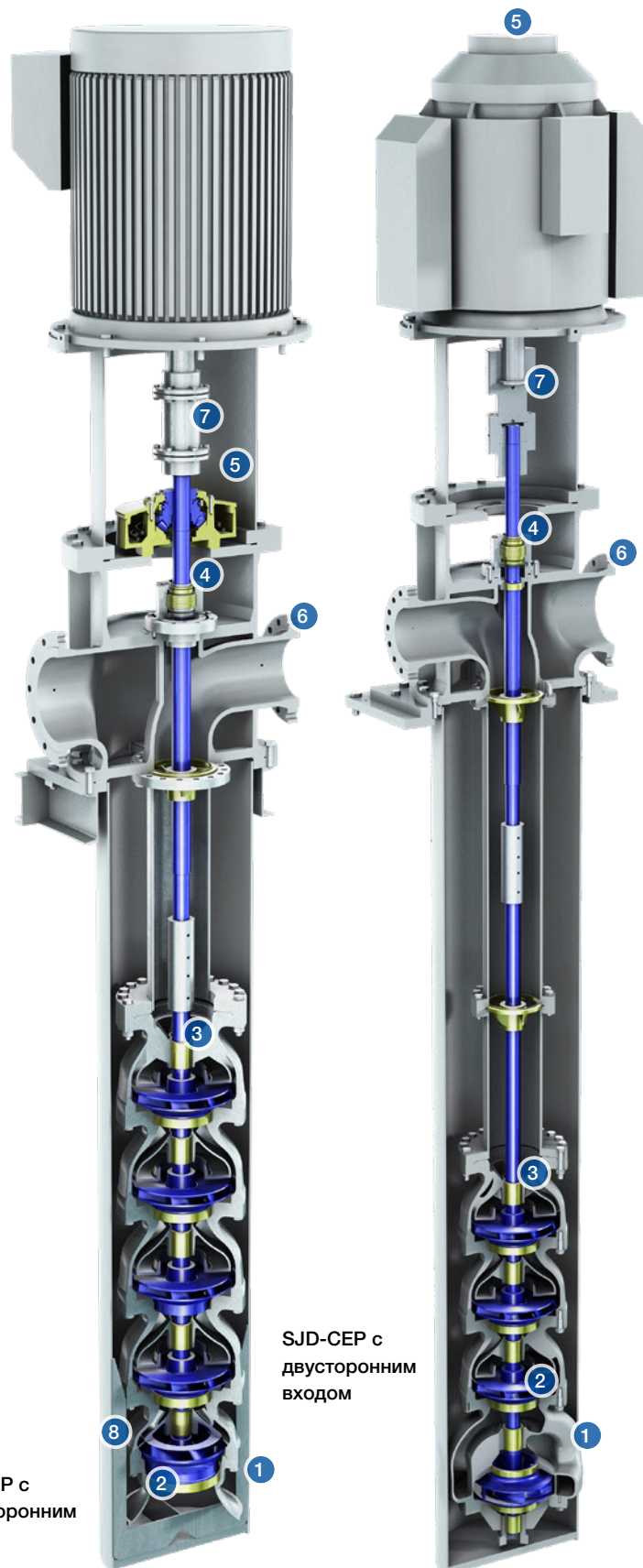
SJD-CEP с односторонним входом