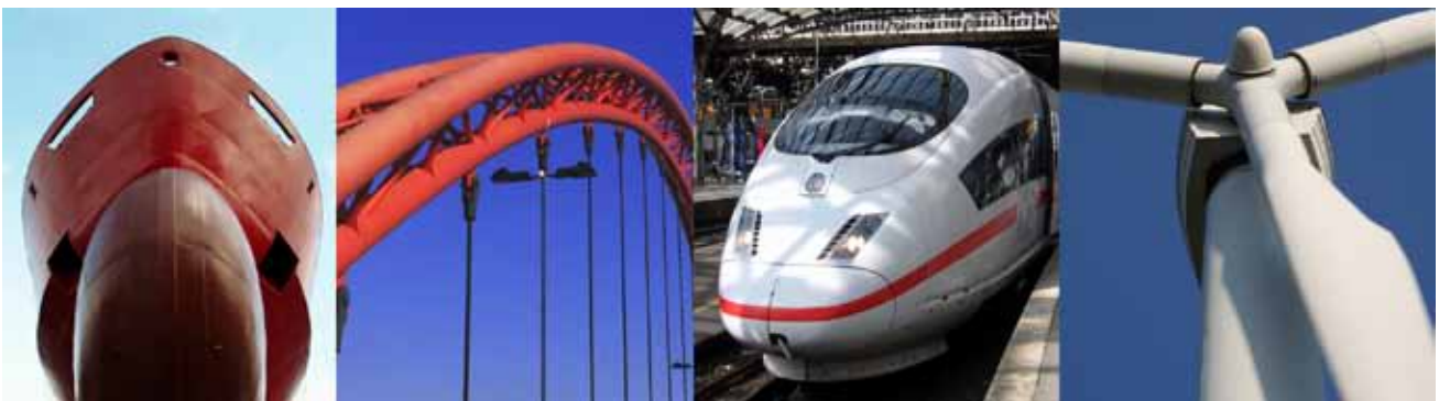
Bild 1: „Anwendungsbereiche für 2-K Beschichtungsarbeiten: Schiffsbau, Stahlkonstruktionen, Eisenbahn und Windenergieanlagen.“

Manuelles Mischen und Austragen jedoch birgt zahlreiche Nachteile und Risiken. Sowohl das Mischen als auch das Austragen sind sehr zeitaufwändig. Bei der Bearbeitung großer Flächen müssen beide Arbeitsgänge abwechselnd wiederholt werden, da die fertige Mischung nur für eine begrenzte Zeit verarbeitbar bleibt, bevor sie aushärtet. Außerdem entsteht mitunter erheblicher Materialverlust – durch Reste in angebrochenen Verpackungen aber auch durch ungleichmäßiges Auftragen mit dem Pinsel.