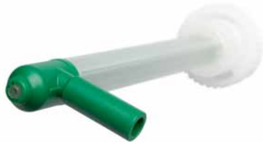
Bild 3: Sprühmischer auf Basis der bewährten QUADRO Mischtechnologie.

Sulzer kann hier auf seine patentierten Technologien zurückgreifen. Die Kartuschen werden von hinten befüllt, ein Ventilkolben schließt die Kartusche nach hinten ab und verhindert Lufteinschlüsse. Vorne stellt ein spezielles Auslasssystem (F-System) sicher, dass beide Komponenten erst im Mischer in Kontakt kommen. Die Kartuschen sind so kodiert, dass sie nicht falsch an den Mischer angeschlossen werden können. Sie sind wiederverschließbar, angebrochene Kartuschen können wiederverwendet werden, bis sie komplett entleert sind.