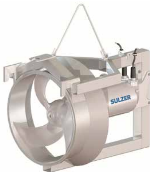
XRCP 800-PA 250/4 = 455 公斤