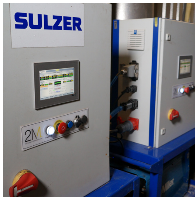
Transportable Steuerungsschränke der Schweißautomaten