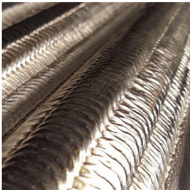
Qualitätsmerkmal - Gleichmäßige Schuppung der Schweißraupen

Die Verbesserung der Kesselleistung und Anlagenverfügbarkeit ist eine ständige Herausforderung für Kesselbetreiber und Wartungsteams. Sulzers Lösungen für Auftragschweißarbeiten sind darauf ausgelegt, die Betriebssicherheit der Anlagen unserer Kunden zu erhöhen, die Leistung zu verbessern und die Konsistenz der Ertragsströme zu steigern.