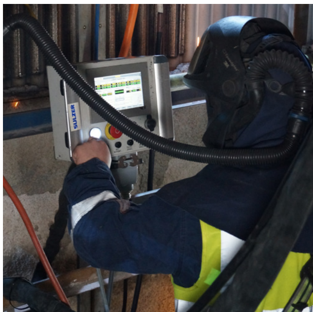
Überwachung des Schweißvorgangs am System