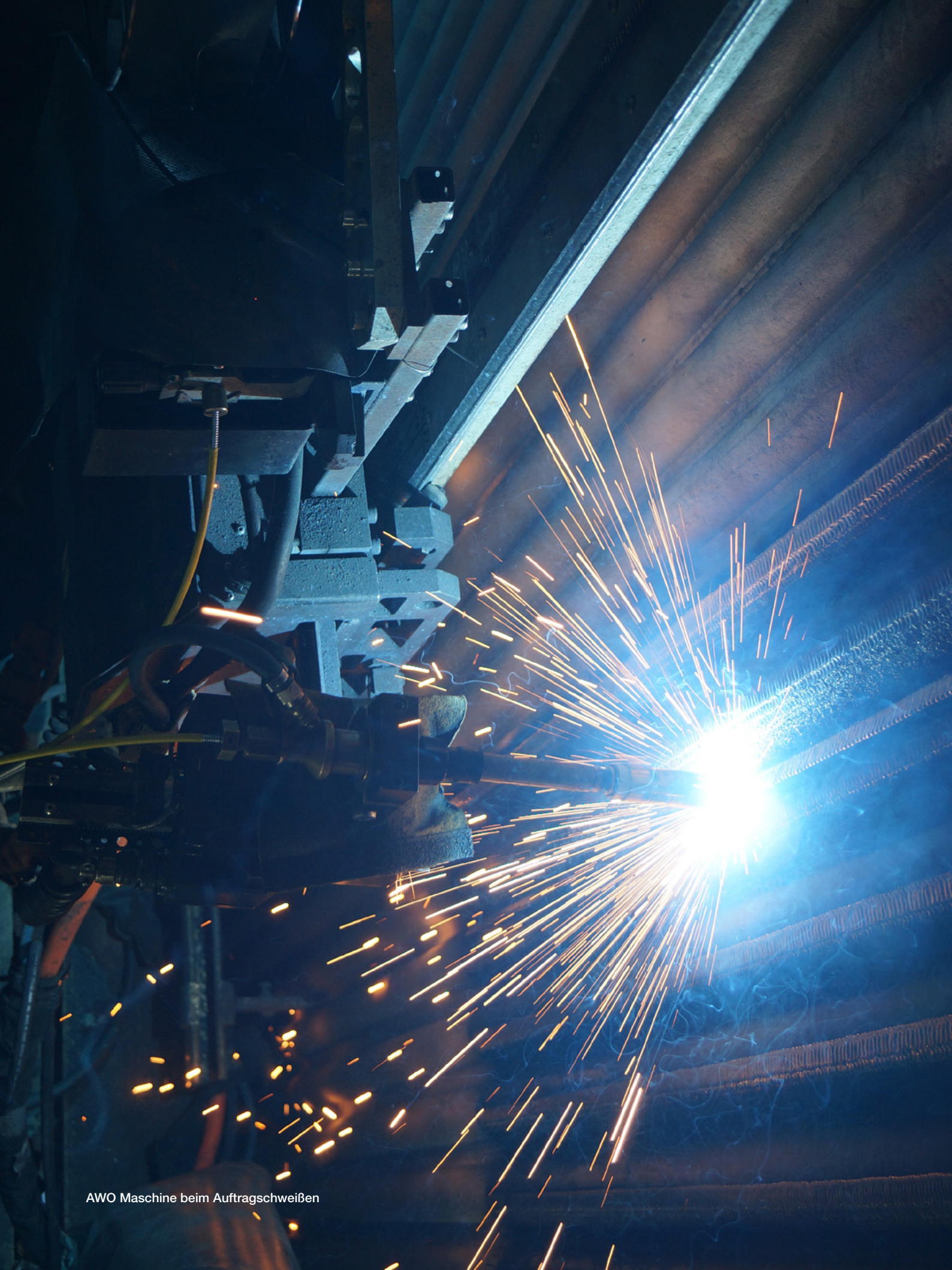
AWO Maschine beim Auftragschweißen