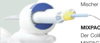
S-Dispenser II mit Kartusche und Colibri Mischkanüle aus dem Hause Sulzer Mixpac AG

Die Industrie liefert immer häufiger Mehrkomponenten-Materialien in Kartuschen. Verschiedene Mischervarianten vereinfachen die Applikation, doch leider gibt es nicht immer bei Standardsituationen. Ausserdem geht der Trend zu minimalinvasiven Techniken, die grazile Instrumente und Applikationshilfen erfordern. Die Sulzer Mixpac AG hat seit längerem Mischer mit einer biegsamen Metallkanüle im Sortiment, die uns in vielen Situationen die Arbeit erleichtern können. Ich hatte über mehrere Wochen die Möglichkeit, diese Mischer intensiv zu testen – und war begeistert.