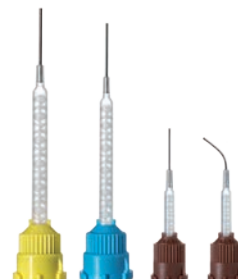
Die Metallkanülen des Colibri weisen die Aussendurchmesser 0,9 mm, 1,1 mm und 1,4 mm auf.

Die Metallkanülen sind aus medizinischem Edelstahl gefertigt und lassen sich einfach von Hand bis zu 180° biegen, ohne dabei den Innendurchmesser der Kanüle zu verändern. Nach dem Biegen ist die Kanüle frei drehbar und lässt sich individuell an die jeweilige Behandlungssituation anpassen. Die Enden der Metallkanülen sind entgratet und minimieren somit die Verletzungsgefahr von Weichgewebe.