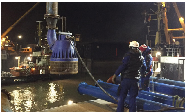
Mietpumpe ist mittels Flanschübergang fest mit der Stahlrohrleitung DN 350 verbunden

Die Aufbauarbeiten konnten nur bei Niedrigwasser und wenig Wind stattfinden. Im ersten Anlauf konnten die mobilen Tore mithilfe der eingesetzten Schiffe nicht erfolgreich positioniert werden. Kein dichter Verschluss konnte erreicht werden, weil der Grund zu stark verschlamm war. Die Standfläche der mobilen Tore mussten im flexiblen Dauereinsatz schnellstmöglich entschlammt werden. Nur durch zusätzliche Pumpentechnik (Mietpumpen) und verlängertem Arbeitseinsatz konnte bei der übernächsten Ebbe der temporäre Verschluss der Kaiserschleuse erreicht werden.