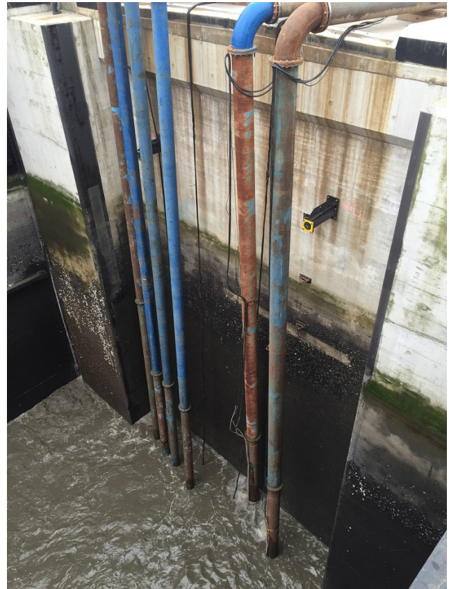
Mietpumpeneinsatz im Schleusenbecken. Zu sehen ist die parallele Installation der 6 Flanschrohre inklusive Bögen