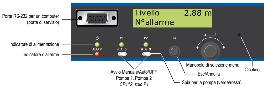
Figura 1-1 Per ogni pompa (P1 e P2), c'è una spia che indica se la pompa è in marcia (verde) o è ferma (rossa), e sotto di essa si trova un interruttore per controllare se la pompa è in modalità Auto (A), è spenta (O), o si sta cercando di avviarla manualmente (H).

La Figura 1-1 mostra il pannello. La schermata principale del display a due righe mostra dinamicamente lo stato del pozzetto (il livello nel pozzetto o lo stato dei galleggianti di avvio) e l'eventuale presenza di allarmi. L'unità tornerà sempre a questa schermata dopo 10 minuti di inattività in qualunque altra schermata.